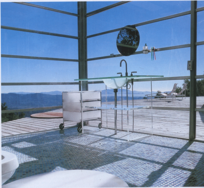
DANS CE DÔME GÉODÉSIQUE DES ANNÉES 50, LE PAYSAGE FAIT PARTIE INTÉGRANTE DU DÉCOR